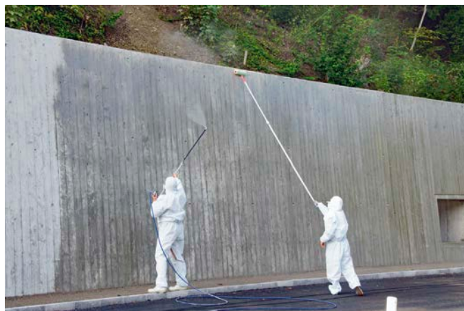
Bild 9: Auftragen von HydroGraff FL-OS-A AGS im Sprühverfahren und Einarbeiten mit der Farbrolle