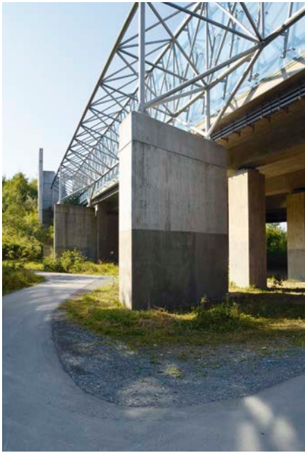
Bild 3: Erste praktische Anwendung von HydroGraff an einem exponierten Stützpfeiler für die Lärmschutzwand an der Autobahn A9 bei Bayreuth

Zum Schutz von Bauteilen, die schädlichen Stoffen wie Chloriden oder Sulfaten ausgesetzt sind und keine ausreichende Qualität der Betondeckung aufweisen, wird als Methode 1.1 empfohlen, das Eindringen dieser Stoffe durch eine Hydrophobierung der Betonoberfläche zu verhindern. Untersuchungen [3] zeigen, dass bei fachgerechter Anwendung über 20 Jahre eine signifikante Reduzierung der Wasseraufnahme nachweisbar ist.