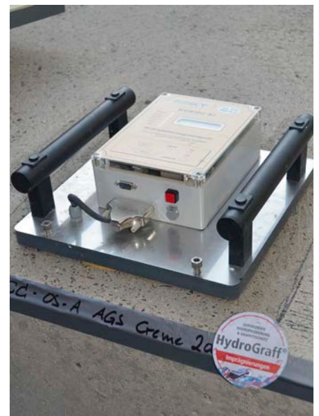
Bild 5: Elektrochemische Messungen an den Pfeilerkappen, ausgeführt durch die Autobahndirektion Nordbayern

Der Auftrag von HydroGraff FL OS-A AGS Flüssig erfolgt in zwei Arbeitsgängen und muss immer nass in feucht erfolgen. Auch hier richtet sich der Verbrauch nach dem Saugverhalten des Untergrunds. Der Regelverbrauch liegt zwischen 150 ml/m 2 und 250 ml/m 2 , kann aber je nach Saugfähigkeit des Substrats auch höher liegen.