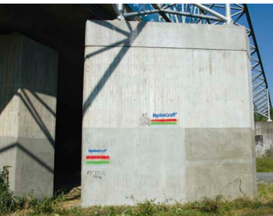
Bild 6: Vertikale Testflächen auf den Pfeilern der Lärmschutzwand

Die Graffiti-Entfernung erfolgt vorzugsweise mit Scheidel Soft Graffiti-Reinigungsemulsion. Es handelt sich dabei um ein wässriges, biologisch leicht abbaubares Spezialprodukt mit Lösemitteln, das typische Graffiti-Sprayslacke und Faserschreiber löst. Das Produkt wird nach gründlichem Aufrühren mit der Bürste aufgetragen. Nach etwa 20-minütigem Einwirken wird der Graffiti-entferner verrieben und die Fläche mit einem Hochdruckreiniger abgewaschen. Optional kann bei noch vorhandenen Rest-Farbschatten im Anschluss mit einem Graffiti-Schattentreiniger nachgereinigt werden.