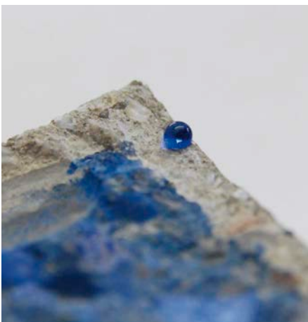
Bild 1: Das Foto zeigt die Wirkungstiefe der Imprägnierung mit HydroGraff CC OS-A AGS Creme.

In DIN EN 1504-9: „Produkte und Systeme für den Schutz und die Instandsetzung von Betontragwerken – Definitionen, Anforderungen, Qualitätsüberwachung und Beurteilung der Konformität – Teil 9: Allgemeine Grundsätze für die Anwendung von Produkten und Systemen“ [2] werden verschiedene Schutzprinzipien für Betontragwerke definiert.