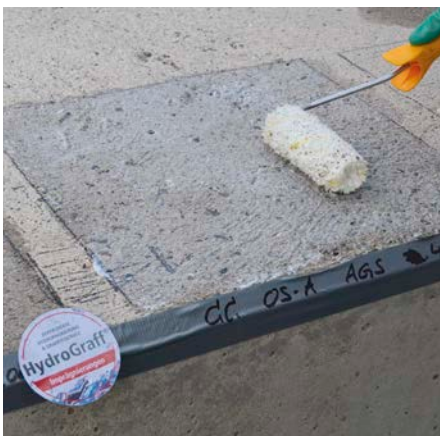
Bild 4: Auftrag der Hydrophobierungscreme auf die Pfeilerkappen zur Ermittlung des optimalen Verbrauchs und zur Vorbereitung für anschließende Messungen

Sind im Beton bereits feuchteabhängige Zerstörungsprozesse im Gang, wie z.B. eine Alkali-Kieselsäure-Reaktion (AKR), dann führt DIN EN 1504-9 als wirksames Schutzprinzip 2 die Regulierung des Wasserhaushalts im Beton durch Hydrophobierung auf. Durch das Stoppen der Wasserzufuhr werden auch die Zerstörungsprozesse aufgehalten. Die erforderlichen Kerneigenschaften „Redu-