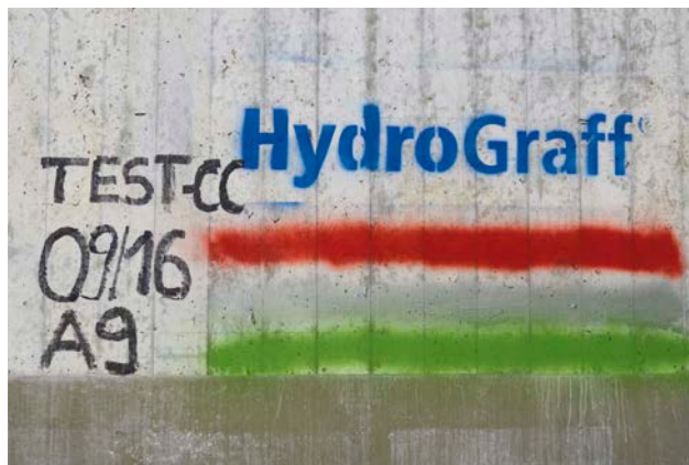
Bild 7: Graffiti wird auf der imprägnierten Fläche durch Soft Graffiti-Reinigungsemulsion nach wenigen Minuten gelöst und läuft ab

Dementsprechend groß war das Interesse der Außenstelle Bayreuth der Autobahndirektion Nordbayern an dem neuen Produkt HydroGraff, mit dem sich beide Probleme durch ein Produkt in den Griff bekommen lassen. Die Mitarbeiter wählten als Testobjekt, für die erste praktische Anwendung,