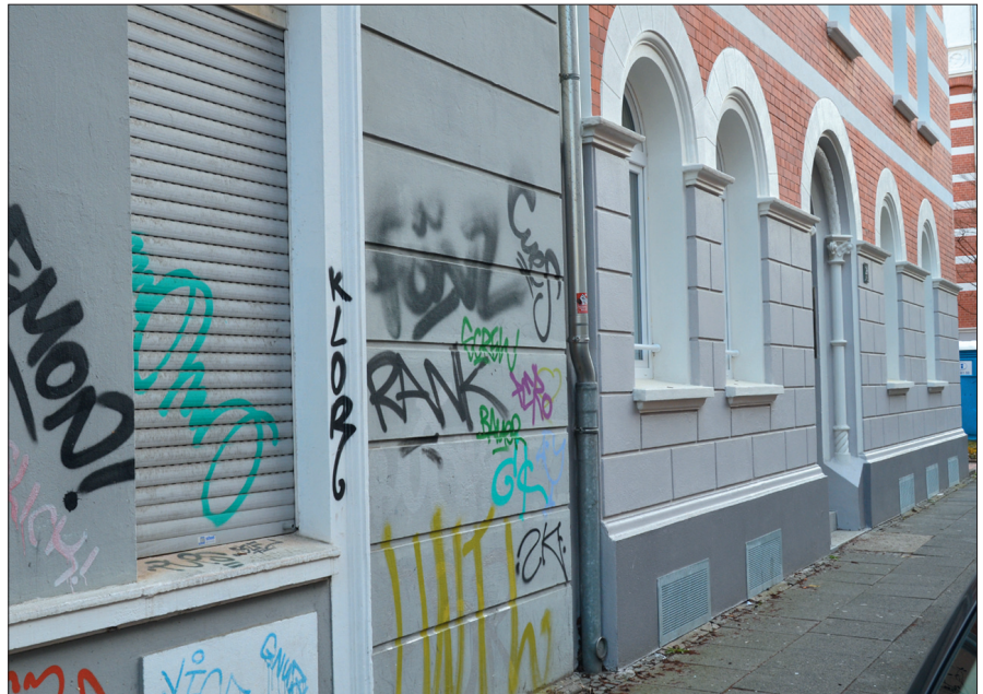
Ohne gut funktionierenden Graffitischutz gab es keine Chancen für saubere Fassaden im Unionviertel Dortmund.

Fluorosil® Premium, Wachs Graffiti-schutz, Kombination aus Fluorosil® Premium und Wachs Graffiti-schutz